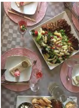
Leckers Abendessen nach dem Kurs